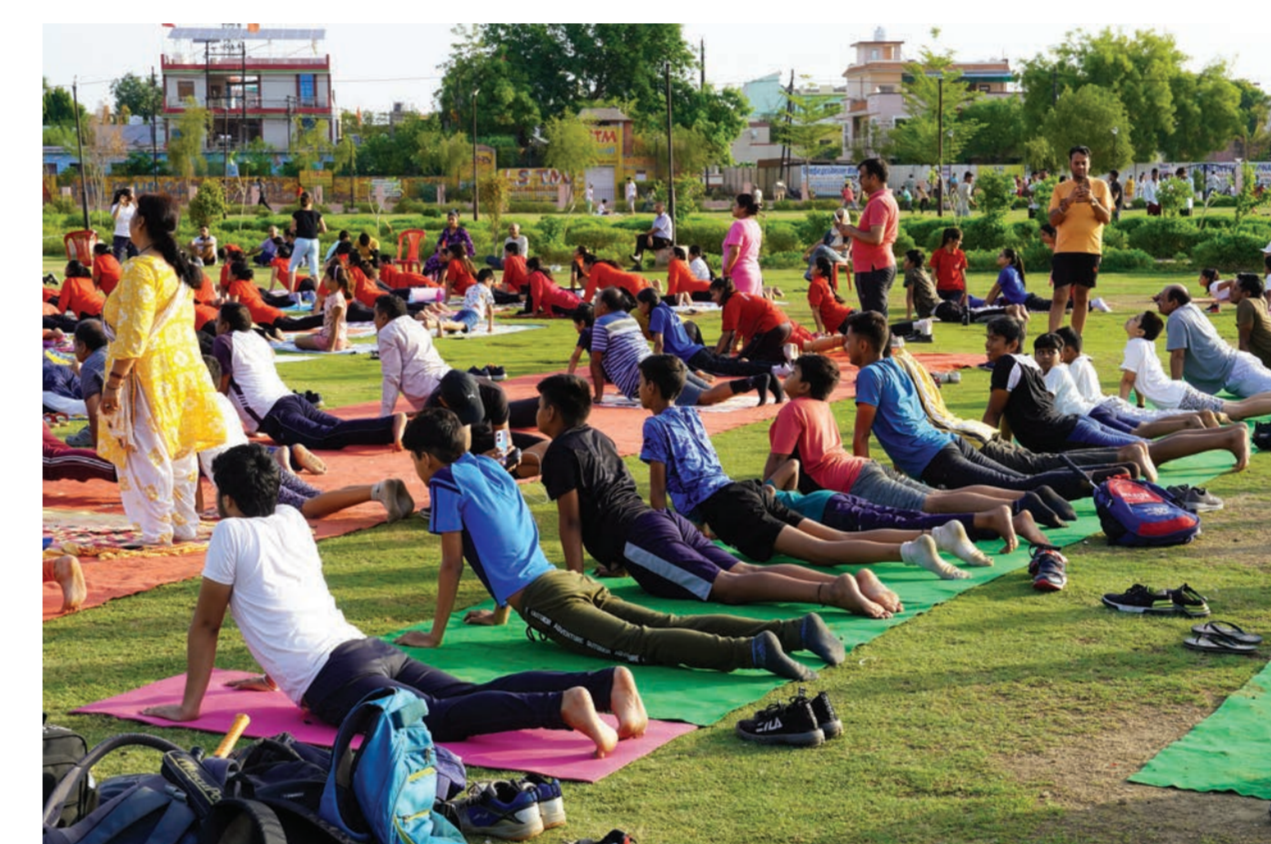
Le yoga en Inde : d'une pratique spirituelle réservée aux ascètes (Sadhus)... à une pratique grand public visant la santé (International Yoga Day).