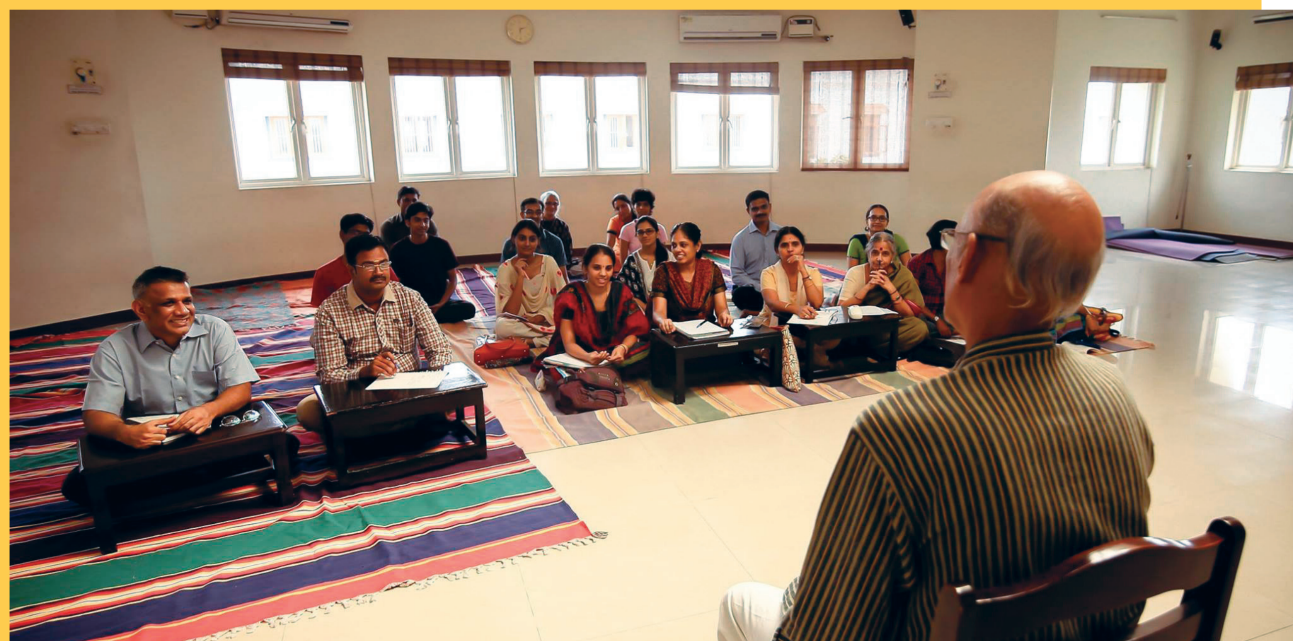
Workshop d'enseignement du yoga, centre KYM, Chennai, Inde (photo : www.kym.org).

80 % des pratiquants français sont des femmes (source : INJEP, 2020)